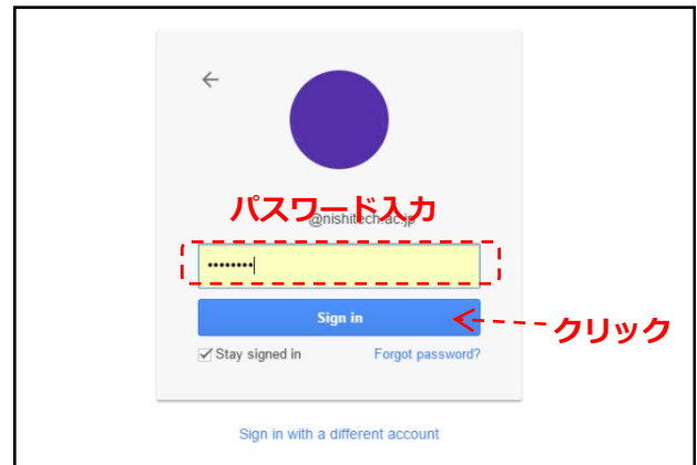
図2：パスワード入力画面