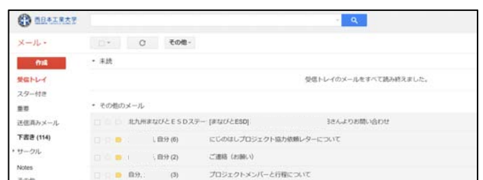
図4：メール操作画面